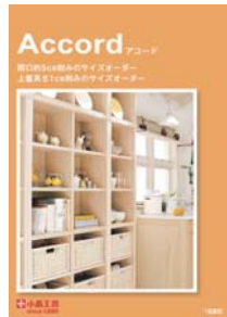
アコード (A4 観音折り)