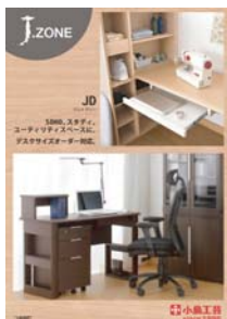
J.zone JD (A4 冊子)