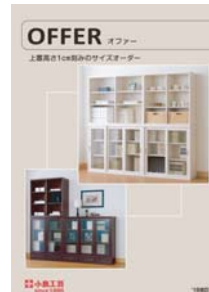
オファー (A4 二つ折り)