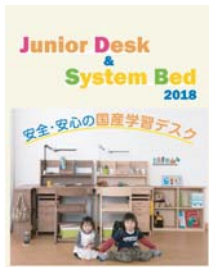
学習デスク・システムベッド (A4 冊子)