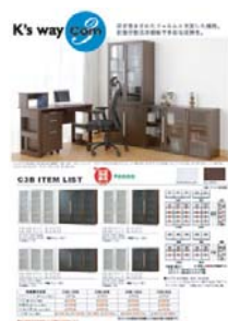
C3B (A4 タテ)