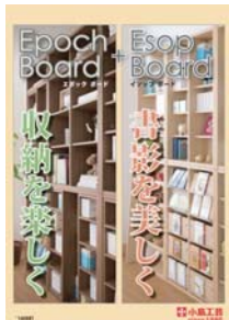
Epoch Board + Esop Board (A4 冊子)