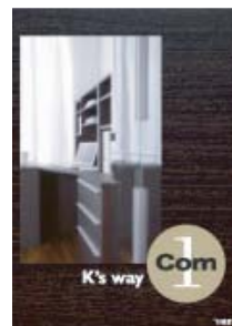
K's way Com1 (A4 二つ折り)