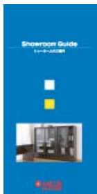
ショールームガイド