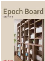
Epoc Board (A4 観音折り)