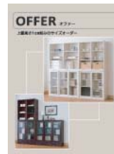
オファー (A4 二つ折り)