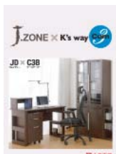
J3D x C3B (A4 二つ折り)