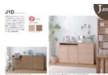
J.zone J1D (A4 ヨコ)