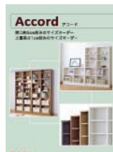
アコード (A4 観音折り)