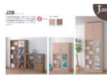
J.zone J2B (A4 ヨコ)