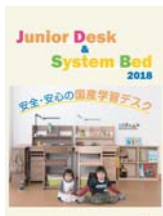
学習デスク・システムベッド (A4 冊子)