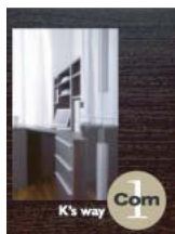
K's way Com1 (A4 二つ折り)