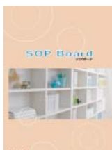
SOP Board (A4 二つ折り)