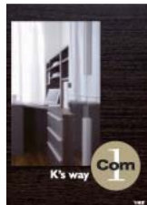
K's way Com1 (A4 二つ折り)