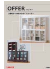
オファー (A4 二つ折り)