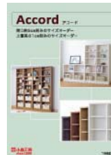
アコード (A4 観音折り)