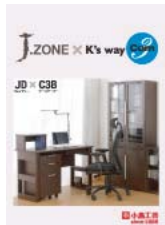
J3D x C3B (A4 二つ折り)