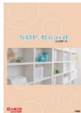
SOP Board (A4 二つ折り)