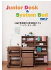
学習デスク・システムベッド (A4 冊子)