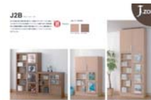
J.zone J2B (A4 ヨコ)