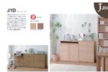
J.zone J1D (A4 ヨコ)