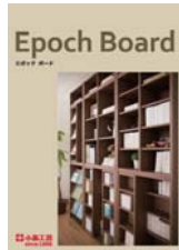
Epoc Board (A4 観音折り)