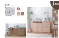
J.zone J1D (A4 ヨコ)