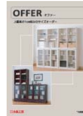
オファー (A4 二つ折り)