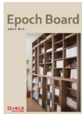
Epoch Board (A4 観音折り)