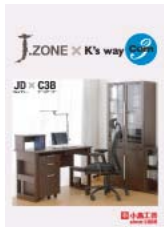
J3D x C3B (A4 二つ折り)