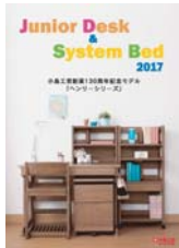
学習デスク・システムベッド (A4 冊子)