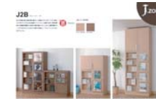
J.zone J2B (A4 ヨコ)