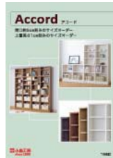
アコード (A4 観音折り)