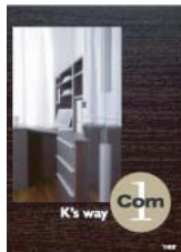
K's way Com1 (A4 二つ折り)