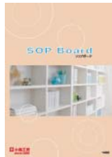
SOP Board (A4 二つ折り)